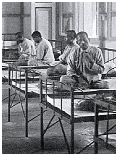
Patiënten in de instelling van Lawang.