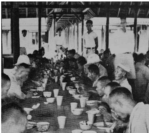
Patiënten van een arbeidstherapeutische kolonie in Nederlands-Indië.

de Javanen, die in zijn ogen eveneens als een natuervolk gekarakteriseerd zouden kunnen worden, echter gedomineerd door dwaasheid en onwetendheid, waardoor zij nooit een waar geluk zouden kunnen bereiken. Waar geluk was